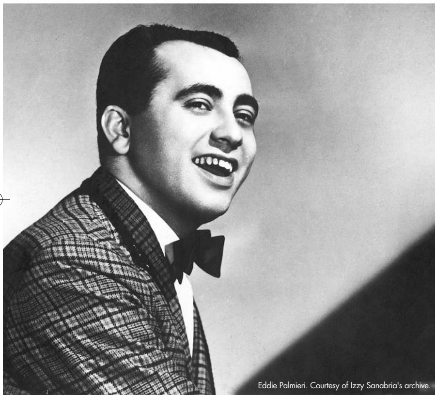
Eddie Palmieri.