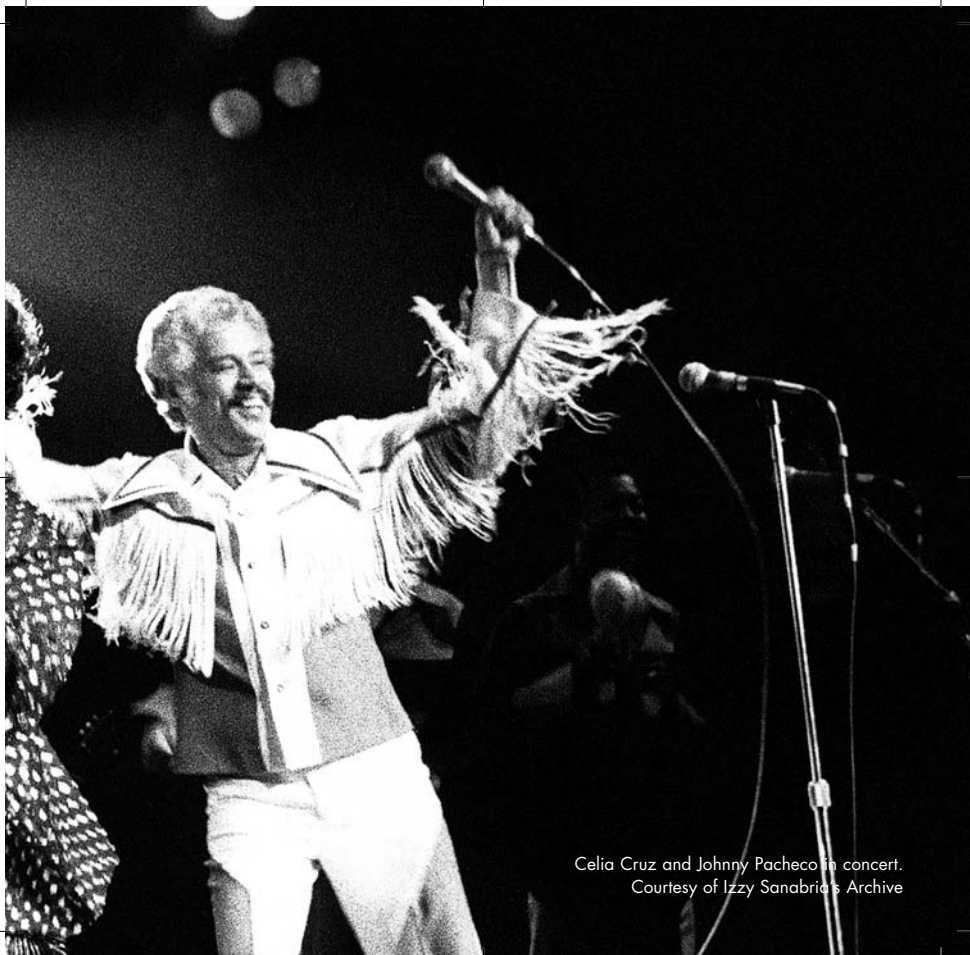
Celia Cruz and Johnny Pacheco in concert.