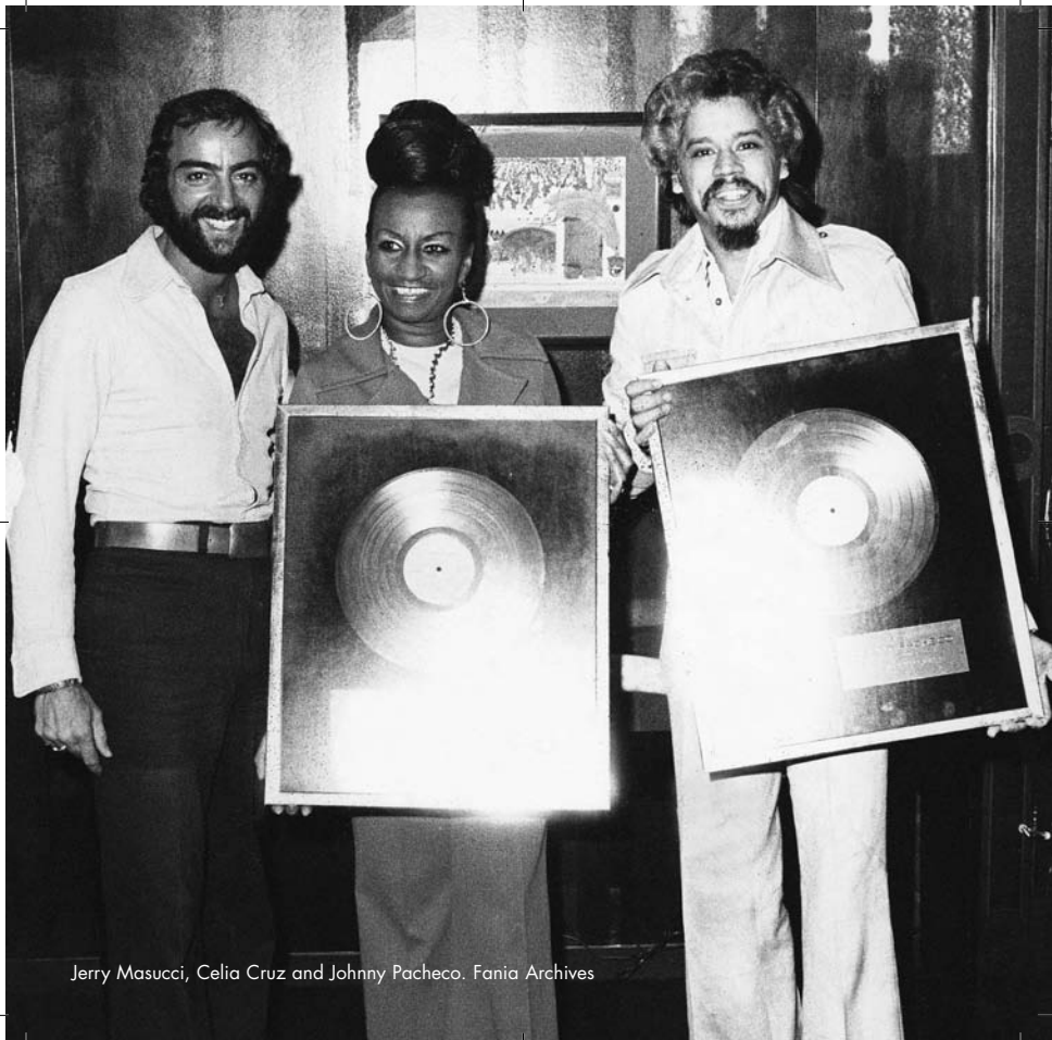
Jerry Masucci, Celia Cruz and Johnny Pacheco.