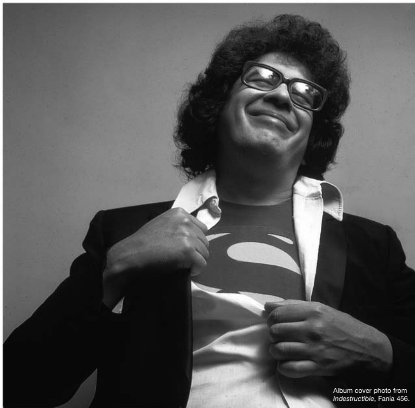
Album cover photo from Indestructible , Fania 456.