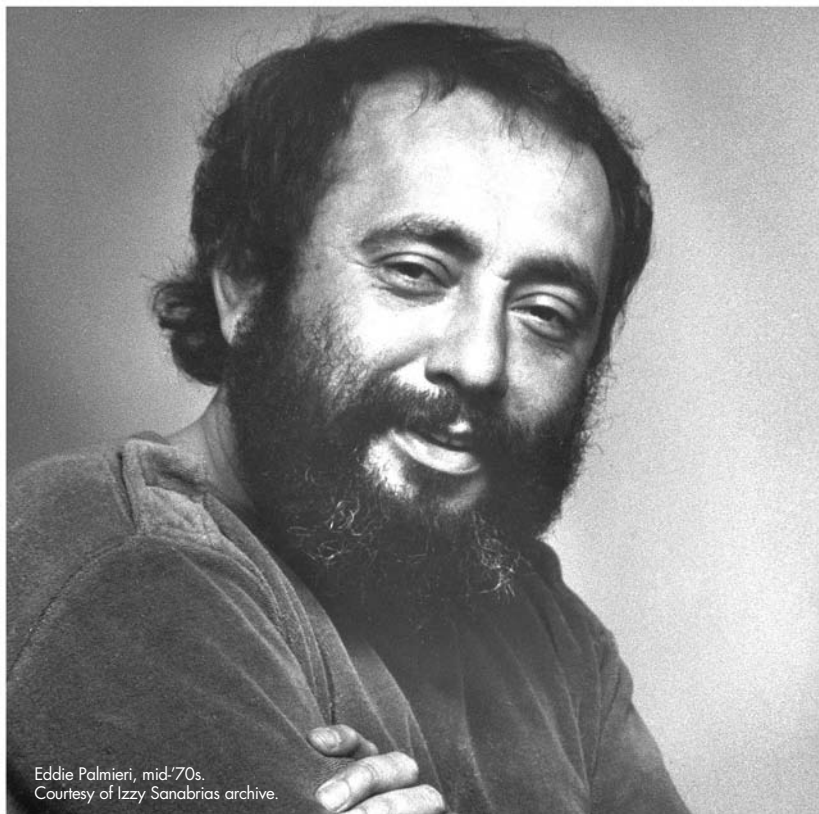
Eddie Palmieri, mid-'70s.