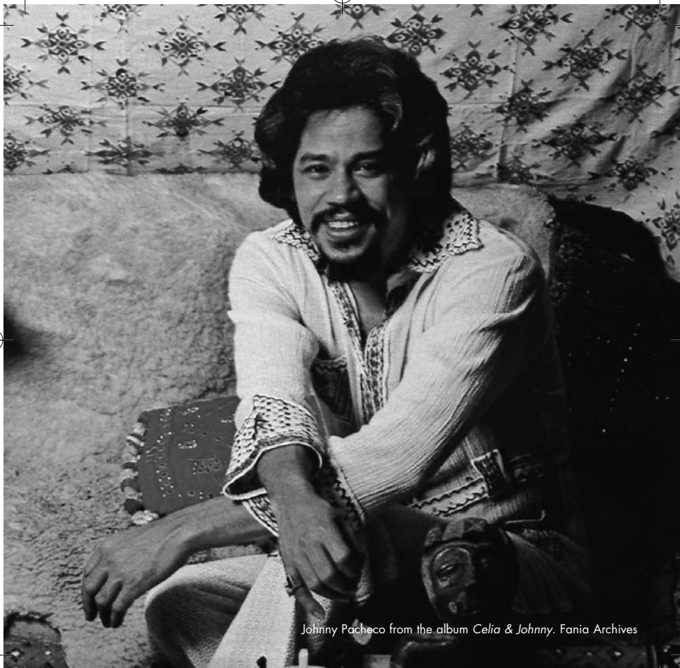
Johnny Pacheco from the album Celia & Johnny.