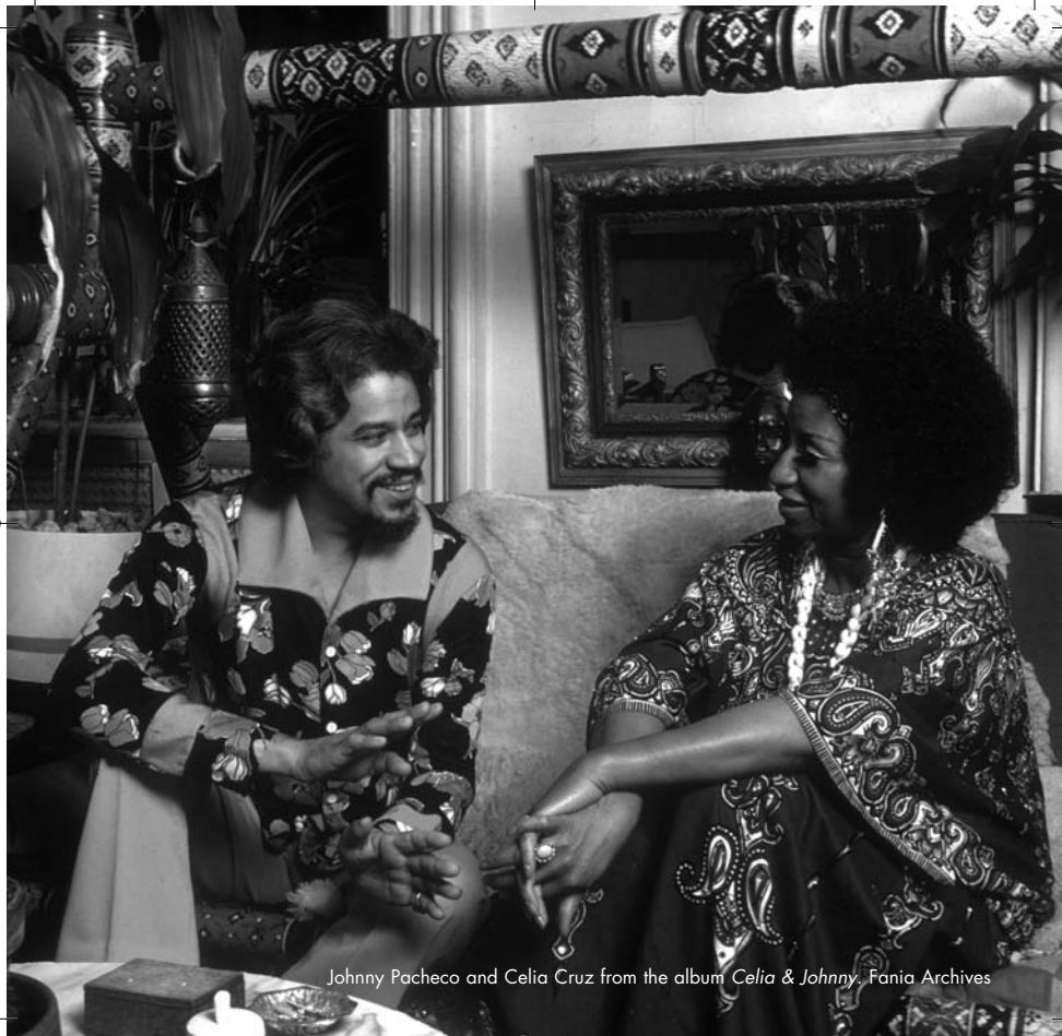
Johnny Pacheco and Celia Cruz from the album Celia & Johnny