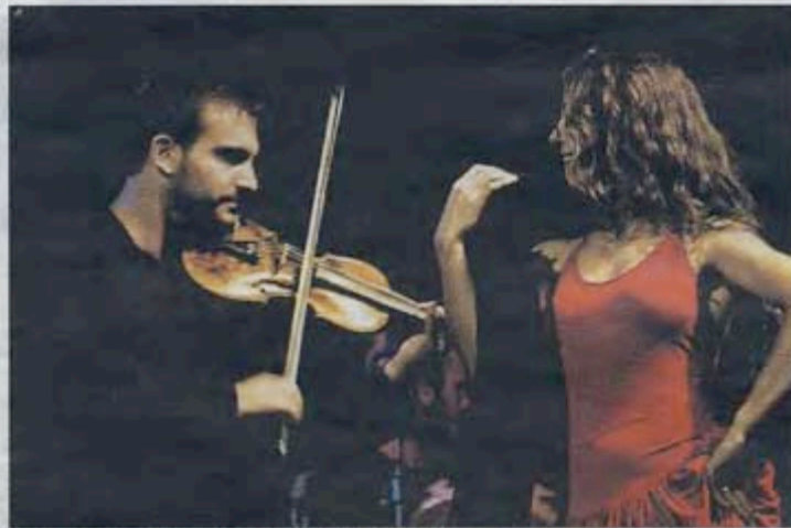
Le groupe Canzoniere Grecanico Salentino. PHOTO DA

Le phénomène du tarentisme, une forme de transe proche des rituels gnawas d'Afrique du Nord, a très tôt intéressé