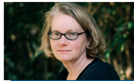
TAINA TERVONEN FINLANDE / FRANCE

Documentariste et journaliste indépendante pour la presse finlandaise et française elle fait parler dans son dernier roman, Les otages , les témoins silencieux d'une histoire longtemps dissimulée, à l'heure de la restitution des butins coloniaux pillés en Afrique.