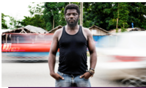
GAUZ' CÔTE D'IVOIRE / FRANCE

Tu mérites un pays , Allary Éditions, 2022