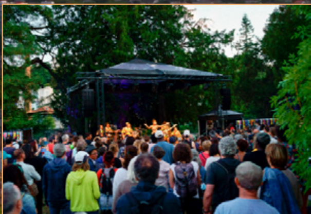
SCÈNE DU JARDIN