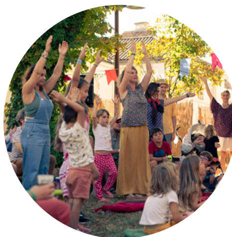
La Batuc à Rideau de Janeiro ESAT André Rideau