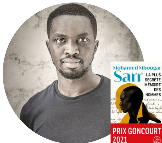
Mohamed Mbougar Sarr Sénégal

Né à Dakar, il poursuit en France son cursus à l'École des Hautes Études en Sciences sociales après ses études en classes préparatoires littéraires au Sénégal. Il est l'auteur de quatre romans qui abordent des sujets graves, douloureux et souvent tus.