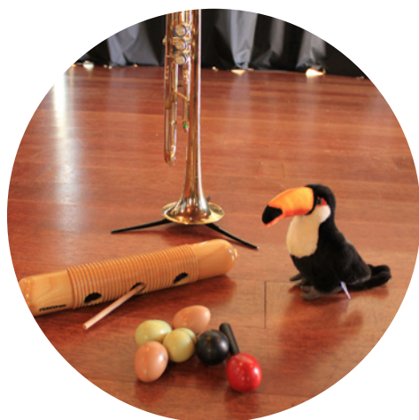
Toco Ricochet Sonore