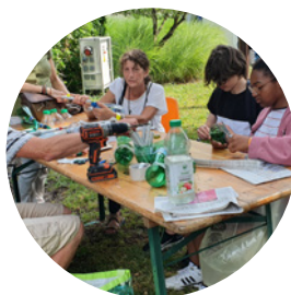
Atelier Les musiciens en herbe La Fabrik Ecolozik