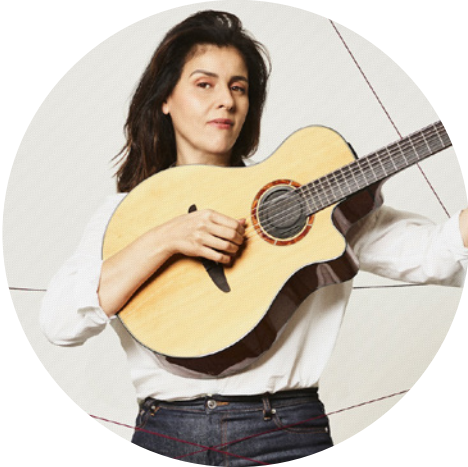
Souad Massi Chaâbi-folk • Algérie