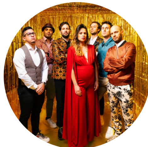
¿WHO'S THE CUBAN? Latin rock fusion • France