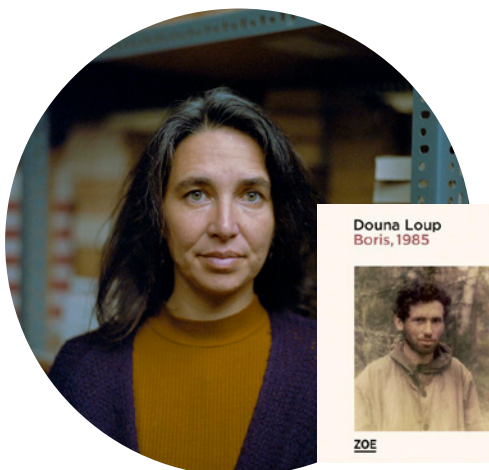
Douna Loup Suisse / France

Elle a grandi dans la Drôme, a travaillé à Madagascar et vit désormais à côté de Nantes. L'intime au féminin, la proximité de la nature, la solitude ont été les thèmes majeurs dans ses premiers livres.