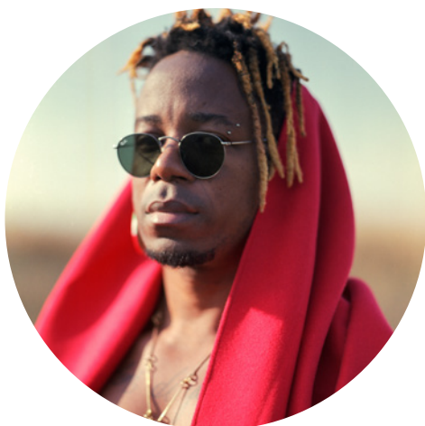
Blick Bassy Afro-soul • Cameroun