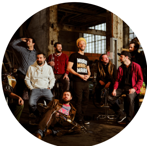
Danakil Reggae • France