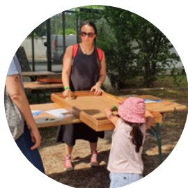
Jeux géants en bois Rives de Charente

Spectacles, jeux, ateliers, boum... Les samedi et dimanche après-midis, l'espace jeune public de Musiques Métisses fourmille d'animations pour petits et grands !