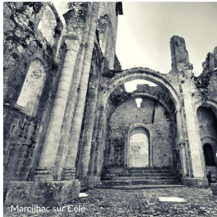
Marcihac sur Célé