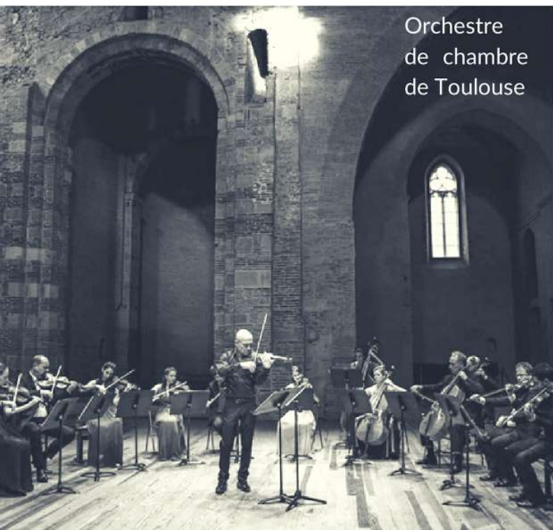
Orchestre de chambre de Toulouse